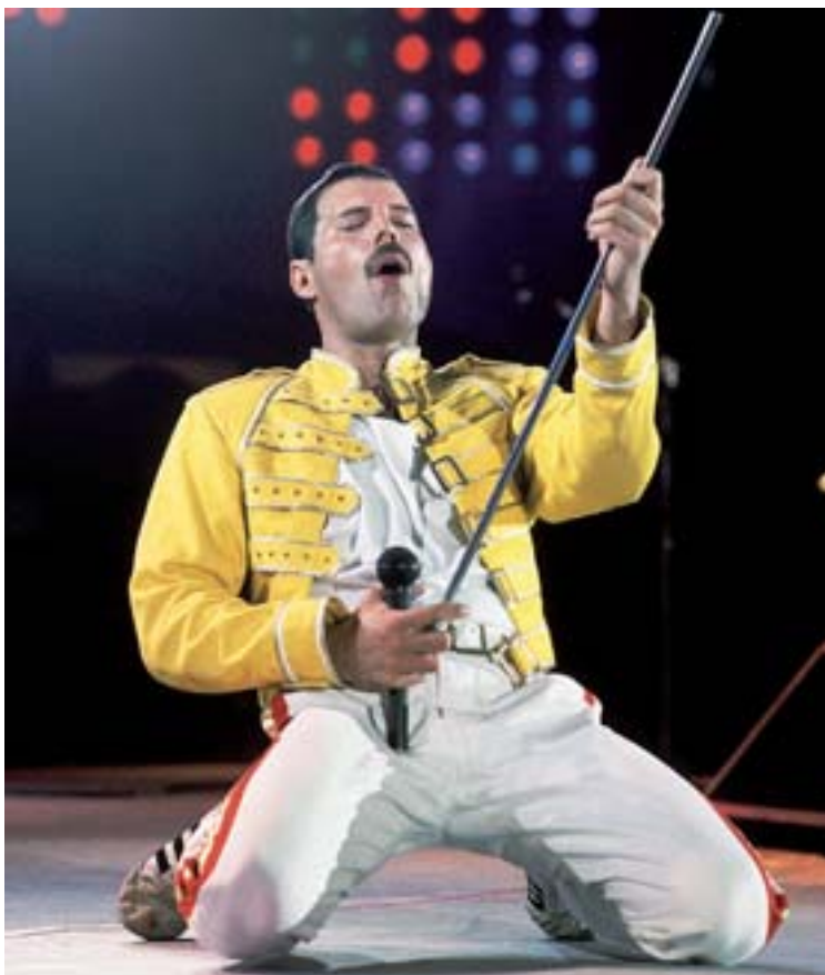
Freddie Mercury (1946-1991) in concerto

A proposito di Mary, bisogna tornare alla viscontiana metafora greca. Nell'omosessualità di Mercury ci sono, accoppiati, la schiera degli azzurri delfini da gineceo e la forza del Minotauro. La temibile stabilità della seconda segue ai fantasiosi «salti felici» nel mare dei delfini. Con Mary, Mercury costruisce un legame che non esita a definire «immenso»; tutti i suoi amanti continuano a chiedergli perché non